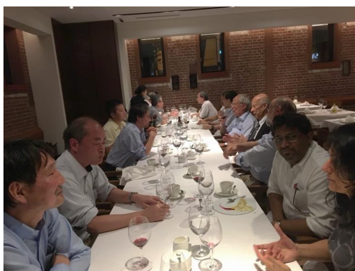
招待講演者・国際アドバイザー委員・国内組織委員による反省会・将来検討委員会 (東京大学伊藤国際学術研究センター)