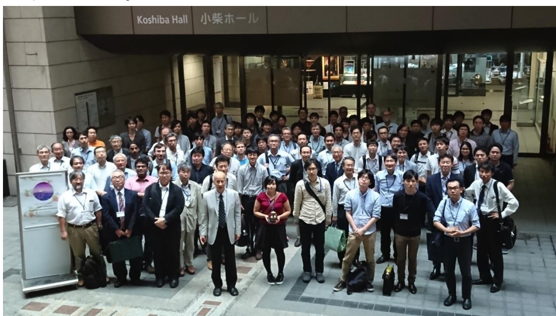
山田科学振興財団・金森順次郎記念国際シンポジウム集合写真（東京大学小柴ホール）